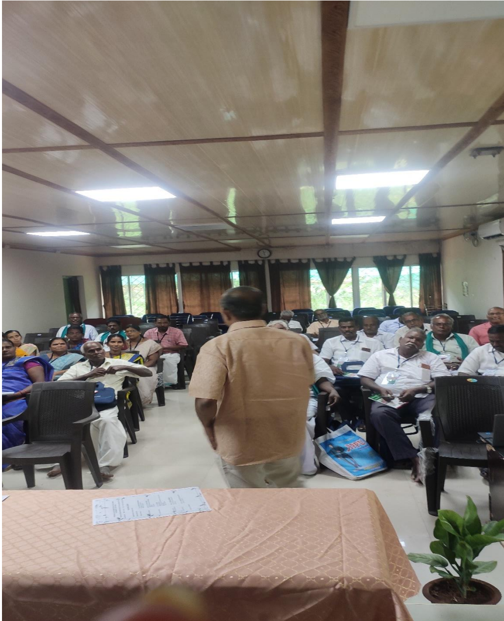
(Addressing the participants by Head KVK, Puducherry)