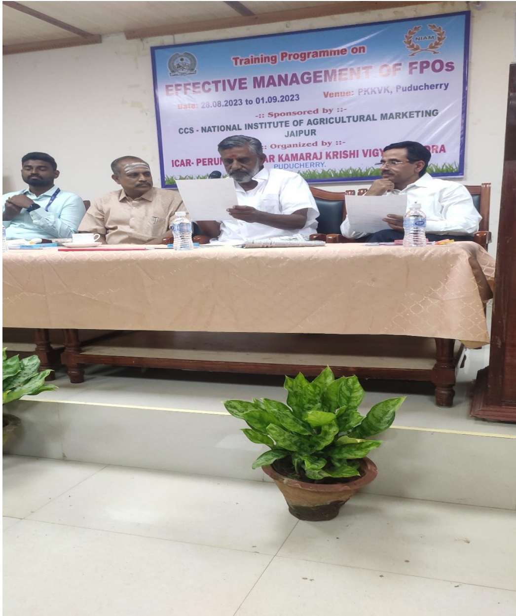
(Addressing the participants by Hon'ble Minister of Agriculture, Sh. C. Djeacoumar, Government of Puducherry)